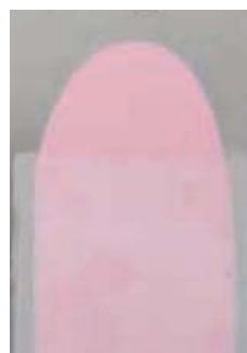
Compétiteur « A »