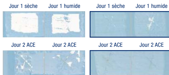
Compétiteur « A »

Mode d'essai : Les essais d'adhérence sèche/humide sont effectués en laboratoire sur des panneaux de placoplâtre crayeux sur lesquels l'adhérence est difficile. Après une période de séchage de 1 et 2 jours une hachure en croix est appliquée et l'adhérence sèche et humide est mise à l'essai à l'aide d'un ruban spécifié ASTM. Les essais d'adhérence cyclique environnementale ont été exécutés en laboratoire sur plusieurs jours pendant qu'ils étaient exposés à des variations de températures et de conditions.