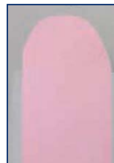
NOUVELLE peinture d'extérieur Dulux Diamant