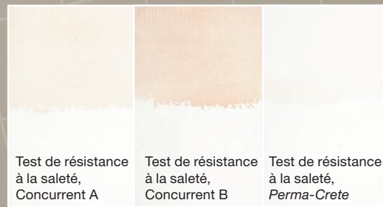
Test de résistance à la saleté, Concurrent A

La Couche de finition acrylique Perma-Crete au pouvoir garnissant élevé est formulée pour être durable et sans entretien. Elle offre un fini mat ou satiné décoratif qui protège les surfaces extérieures en maçonnerie. Ce revêtement auto-apprêtant s'applique aisément sur les surfaces de béton frais de plus de 7 jours, accélérant le calendrier de construction et réduisant les coûts du projet en vous permettant d'éliminer une couche. La Couche de finition Perma-Crete au pouvoir garnissant élevé est spécifiquement conçue pour être utilisée sur diverses surfaces de maçonnerie intérieures et extérieures au-dessus du sol, et procure une performance bien au-delà de la peinture conventionnelle.